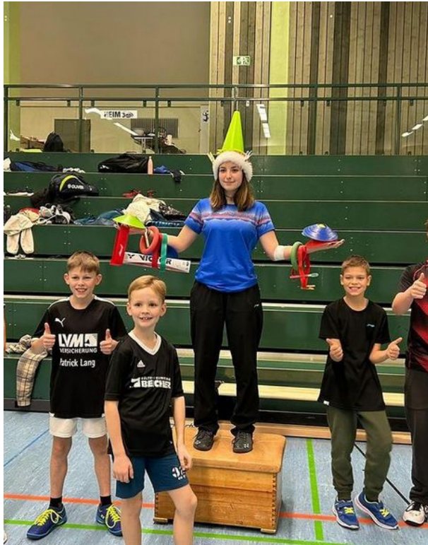
Weihnachtsfeier der Kids gemeinsam mit dem TuS Bad Marienberg