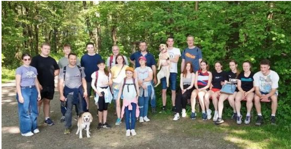
BSG Treffen der Seniorenmannschaften