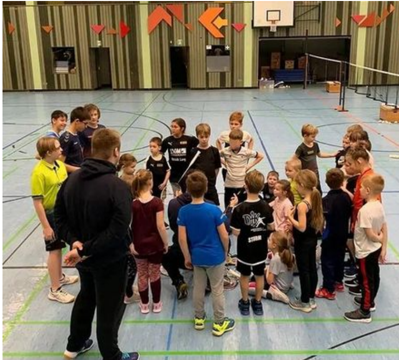
Sichtungslehrgang am LSP in Bad Marienberg