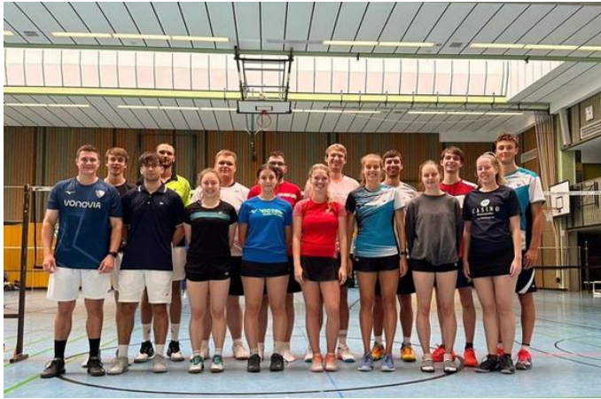
Lehrgang/Sommercamp der Senioren vom TB Andernach