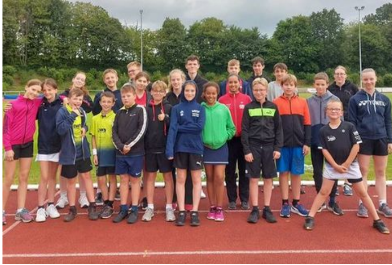
Lehrgang/Sommercamp der Kids am LSP Bad Marienberg