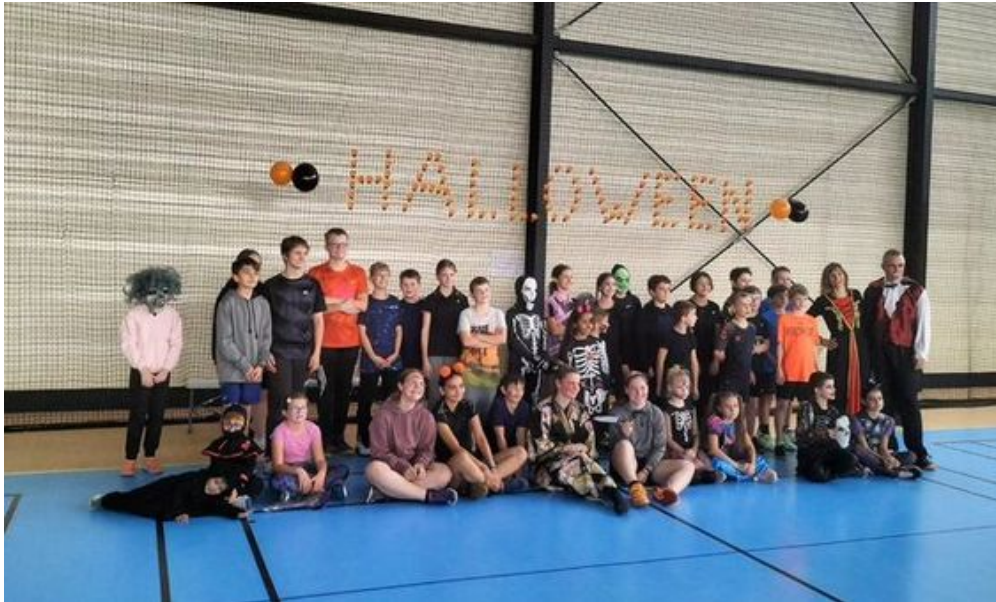
Trainingscamp in Frankreich